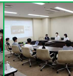
「医学生への質問と 山大病院紹介」