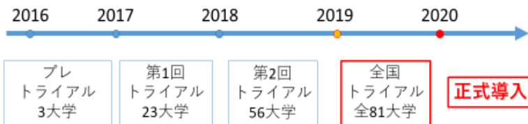
Post CC OSCE 正式実施までのスケジュール

6月30日に国際医療福祉大学成田キャンパスで開催されたPost-CC OSCE評価者講習会に参加してきました。お伝えしています通り、Post-CC OSCEは2017年度からトライアルが開始されており、来年度は全国トライアルが、2020年度からは正式に実施される予定です。卒業前に医師としての基本的診療能力を評価することが目的とされ、学生が講義や臨床実習などで知識や技能を修得することはもちろん、教員側にも、 妥当で、公平で、信頼できる評価 が求められています。講習会では、何をどのように評価すべきか、説明やディスカッションが行われました。ほかにも、既にトライアルを行っている大学の先生のお話を伺うこともでき、評価の難しさはもちろん、その準備や運営の大変さもわかりました。山口大学でも実施に向けた準備を鋭意進めておりますので、学生・教員の皆様も今後の動向を注視いただきますようお願いいたします。